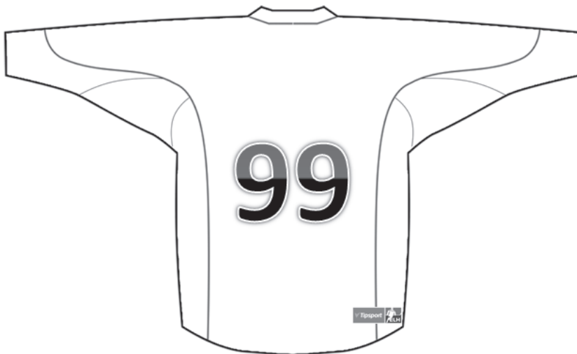
Náhled umístění loga Tipsport ELH na zadní straně dresu

5.10. Každý Klub je povinen předložit řediteli ELH nejpozději do 31. 8. 2021, v případě zvláštních edicí dresů pak 20 dní před konáním utkání, ke kterému má Klub v takových dresech nastoupit, ke schválení design dresů, v nichž má Klub nastupovat v utkáních Tipsport ELH, a to v elektronickém formátu pdf. V případě nedodržení podmínek daných čl. 5.5. tohoto Herního řádu, či v případě nedostatečného kontrastu čísel na zadní straně dresu oproti převládající barvě dresu, má ředitel ELH právo dresy pro utkání ELH neschválit.